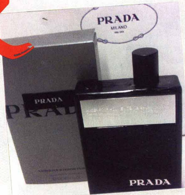
Het binnen, de nieuwe herengeur van Prada: Amber pour homme intense

HET JAAR 2011 IS NOG MAAR NET BEGONNEN, OF ER VALLEN AL VOLOP UITNODIGINGEN OP DE MAT OM DE NIEUWSTE VOORJAARSPRODUCTEN EN GEUREN TE TESTEN. EEN ZOMERS VOORPROEFJE WAS ER EIND JANUARI MET EEN ZONTRIPJE VAN LANCASTER NAAR HET CARIBISCHE ST. MAARTEN. PRE-ZOMER, HERE WE COME! UITERAARD WORDEN VAN TEVOREN NOG EEN PAAR NIEUWE DIEETBOEKEN GETEST. WANT WIE WIL ER IN DE ZOMER NIET GESTROOMLJND OP HET STRAND VERSCHIJNEN? NU BEGINNEN DUS VOOR HET BESTE RESULTAAT.