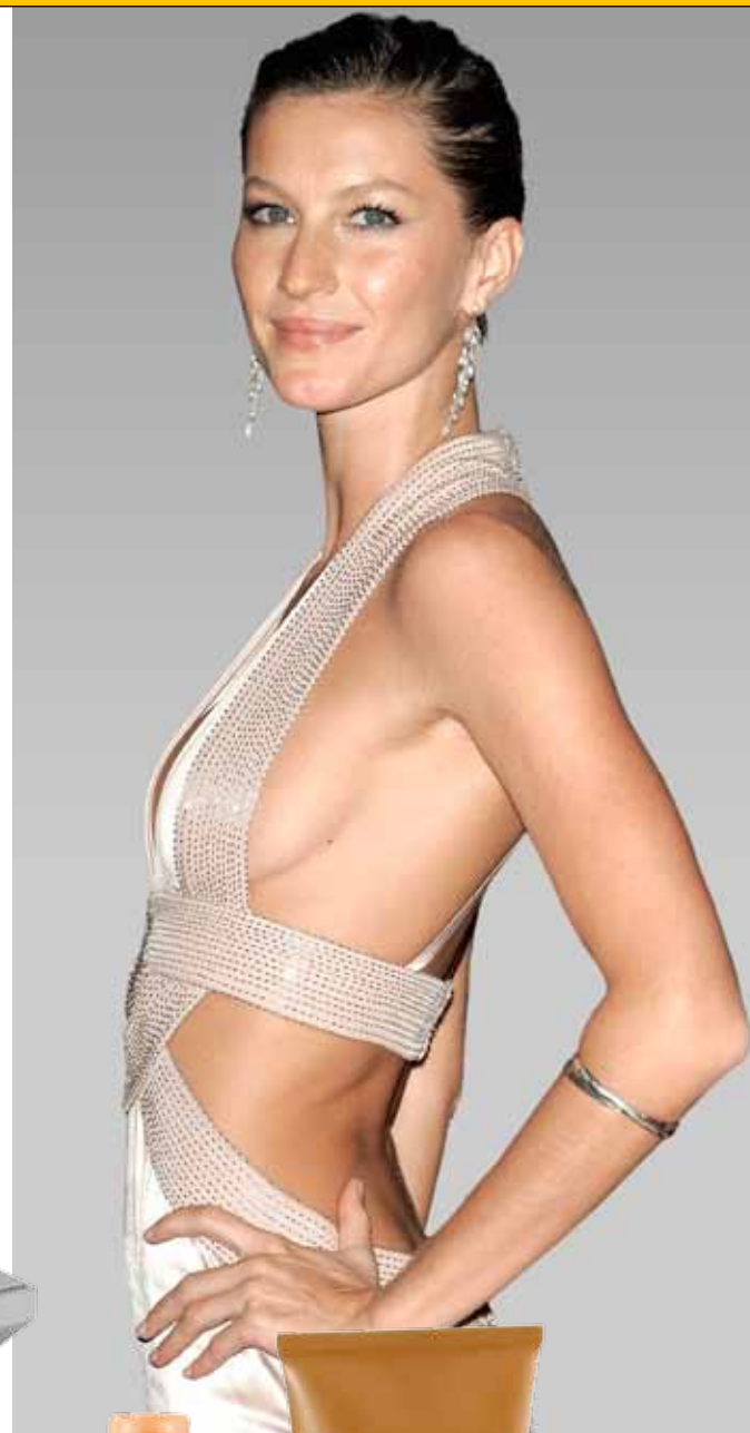
Fade Treatment van hannah (€58)