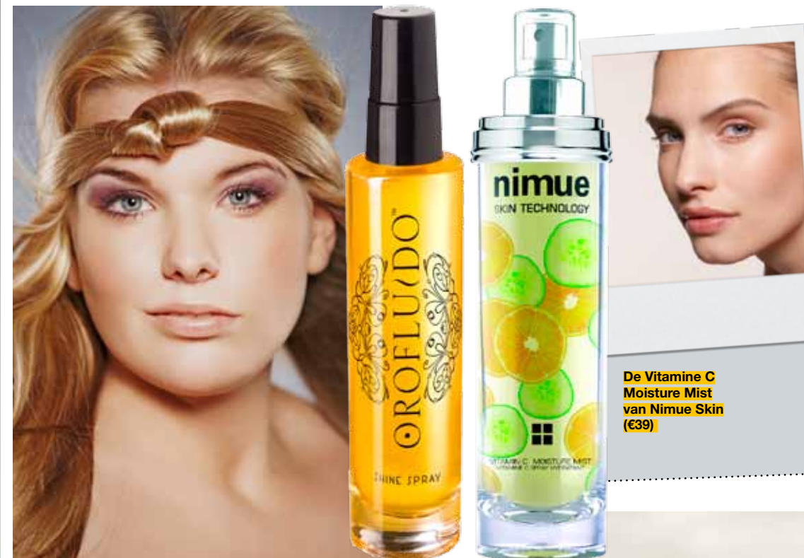
Glansspray Orofluido (€17)