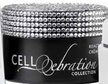
De Anti-Age Cell Formula crème van Biodroga Institut (€51,50)