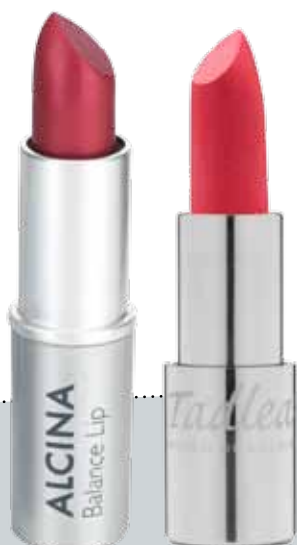
Lipstick van Alcina (€11,35)