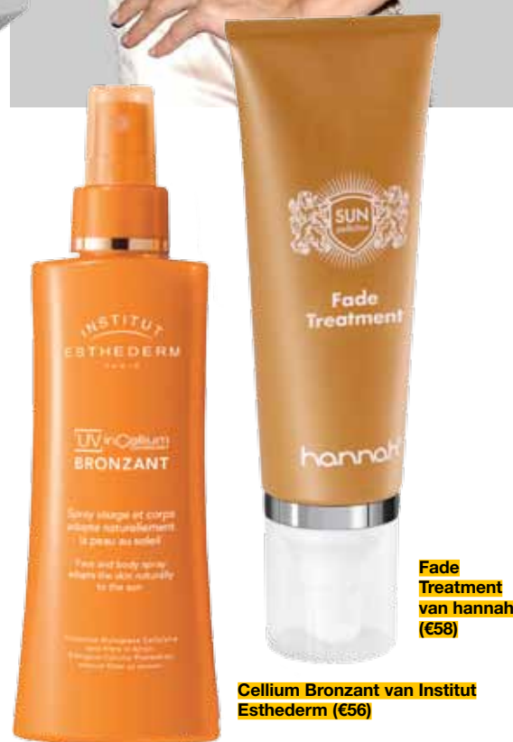
Cellium Bronzant van Institut Esthederm (€56)

Om jaloers op te worden. Zo'n mooie sun kissed look la Gisele Bündchen. Het geheim voor een mooie teint is een goede voorbereiding. Met de UV in Cellium Bronzant van Institut Esthederm (€56) maak je je huid zonproof en tegelijkertijd beschermt het de cellen op een biologische manier. Start 7 dagen voor je vakantie met sprayen om het optimale effect eruit te halen. Heb je al een licht getinte huid van jezelf? Probeer dan de hannah Fade Treatment met Macademia olie (€58) dat de bruining stimuleert en tevens een SPF 10 bevat. Ook bevat de crème zoethoutextract dat huidverkleuringen en pigmentvlekken tegengaat. Mooi als finishing touch is de LOOKX Sun Powder met SPF 20 (€20,50). Hiermee matteer je glanzende zones en de goudpigmenten in de poeder geven je huid een mooie subtiele glans.