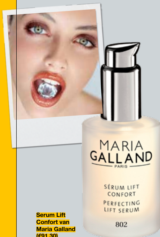
Sérum Lift Confort van Maria Galland (€91,30)

Ben je ook een beauty-addict die niets liever doet dan alleen maar geld uitgeven aan luxe producten voor jezelf? Maria Galland heeft een verstevigend serum dat de huid spankracht en een frisse uitstraling geeft en fijne rimpeltjes verzacht. Je kunt het serum als kuur gebruiken of als je huid even een flinke boost nodig heeft. Sérum Lift Confort (€91,30)