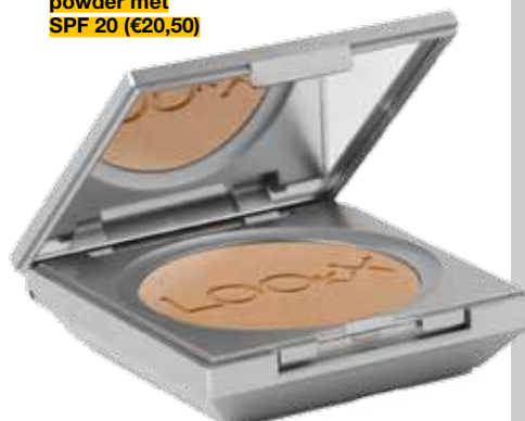
LookX sun powder met SPF 20 (€20,50)